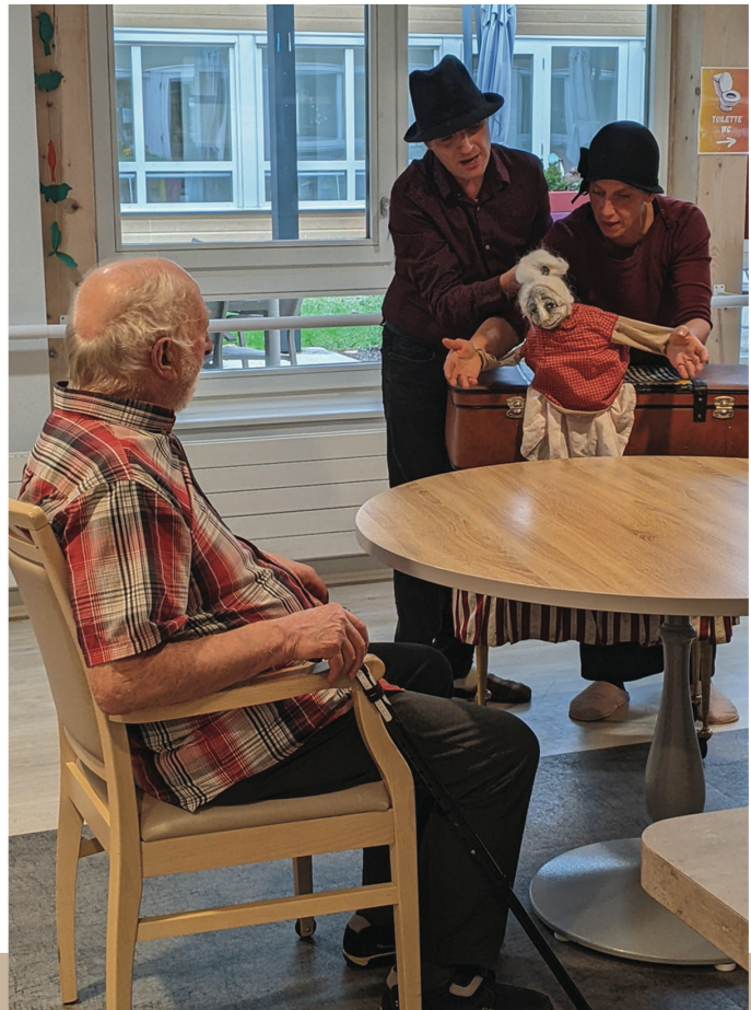
Les marionnettes des vieux enfants offriront les chansons de leur répertoire, des années 30' aux années 80', dans la joie et la bonne humeur !